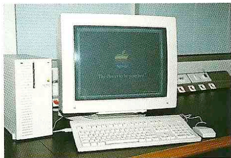
Poste de travail Workstation

The technical platform and its wide scope